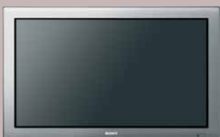
PLATEADO CON RECUBRIMIENTO ACRÍLICO