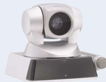
Unidad de cámara

El PCS-1P es compatible con el AES (Advanced Encryption Standard), garantizando la seguridad de la información confidencial durante la videoconferencia vía IP.