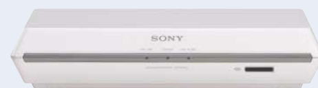
Terminal de comunicación