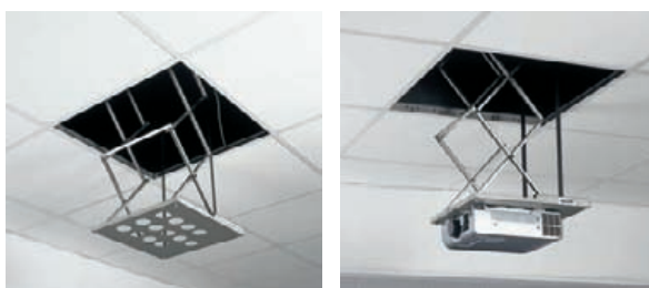
Mini Flexo S-100